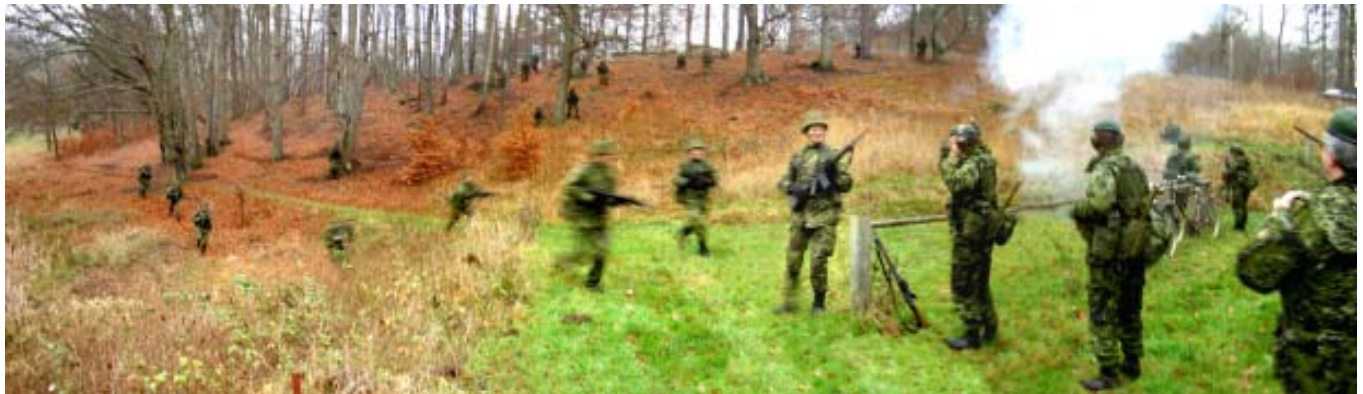
- - - og i det stort anlagte angreb på lejren.