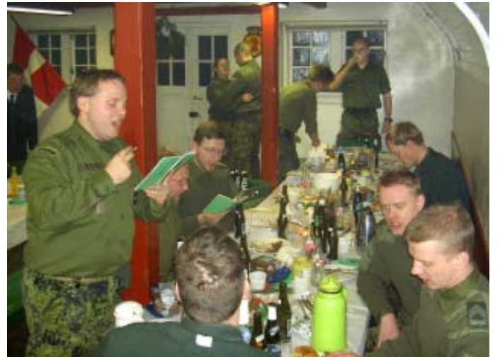
„Det unge bord“ - i god orden under frokosten - og noget senere på eftermiddagen.