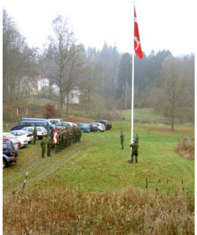
- - - og også mange deltagere i paraden.