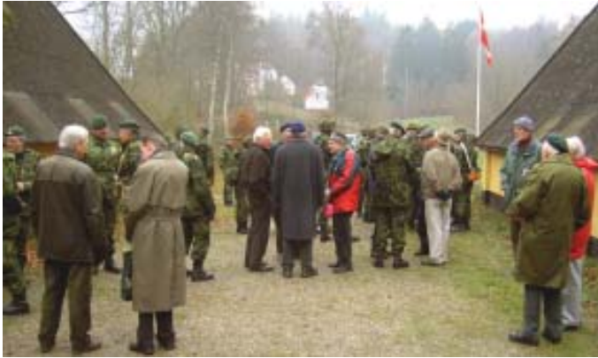
Der var mange tilskuere i lejrgaden - - -